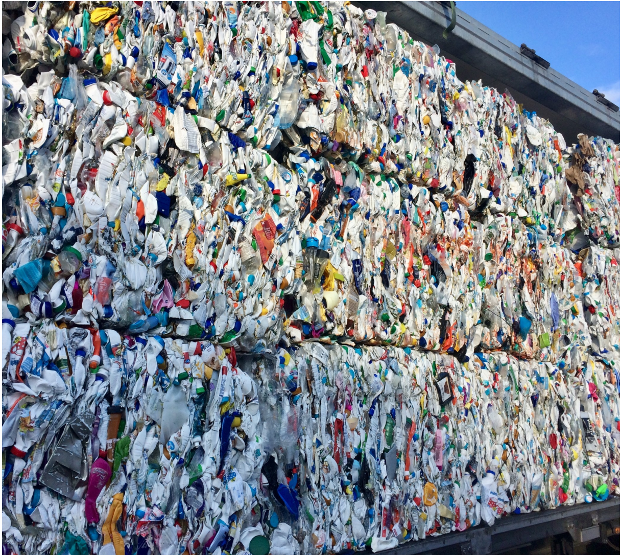
Ces déchets plastiques sont recyclés en nouvelles matières premières, par exemple pour la fabrication d'emballages. Prise chez Innorecycling AG à Eschlikon dans le canton de Thurgovie.