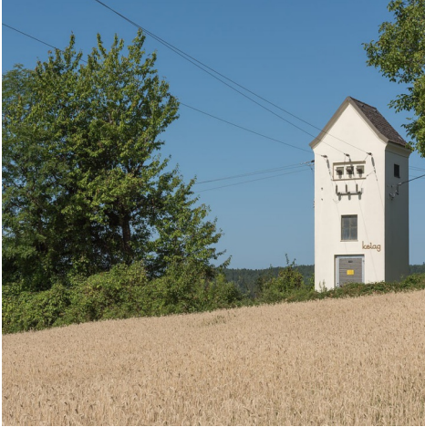
Transformateur électronique à composants SiC

Un petit composant doté d'une grande responsabilité