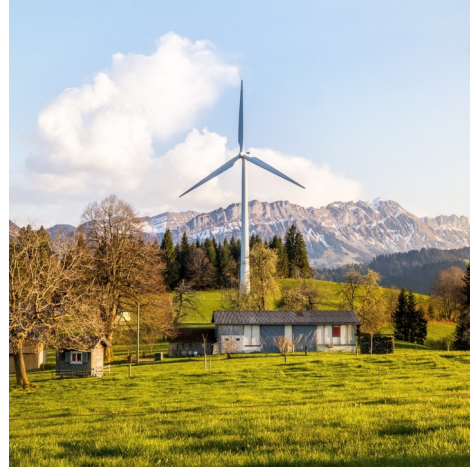
Refroidissement des transformateurs à composants SiC

Utilisation plus efficace de l'énergie électrique grâce aux nouveaux transformateurs SST