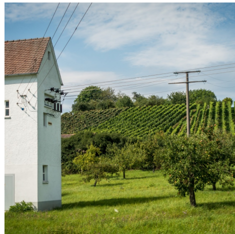
Transformateurs SiC dans le réseau électrique

Système de refroidissement ingénieux pour l'électronique de puissance