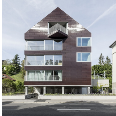
Standards für PV Schöner Strom: Bunte Photovoltaikanlagen sollen Ausbau der Solarenergie vorantreiben