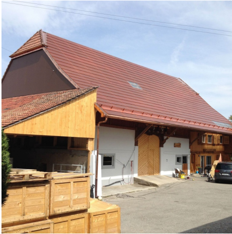
Überwindung der Widerstände gegen PV Mit roten Modulen der Sonne entgegen