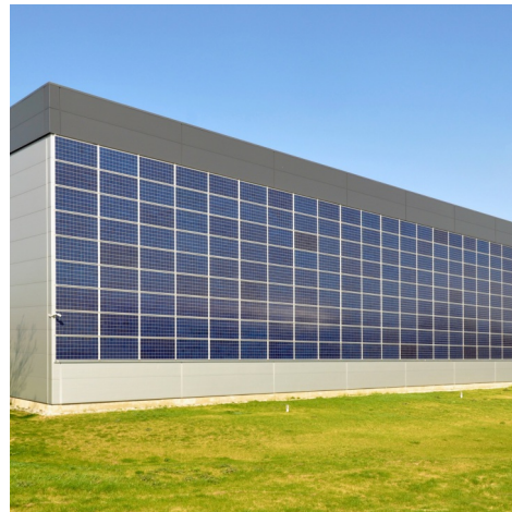
PV und Stadtsanierung

Intelligente Gebäudefassade gewinnt Energie