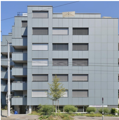
Strategien für gebäudeintegrierte PV