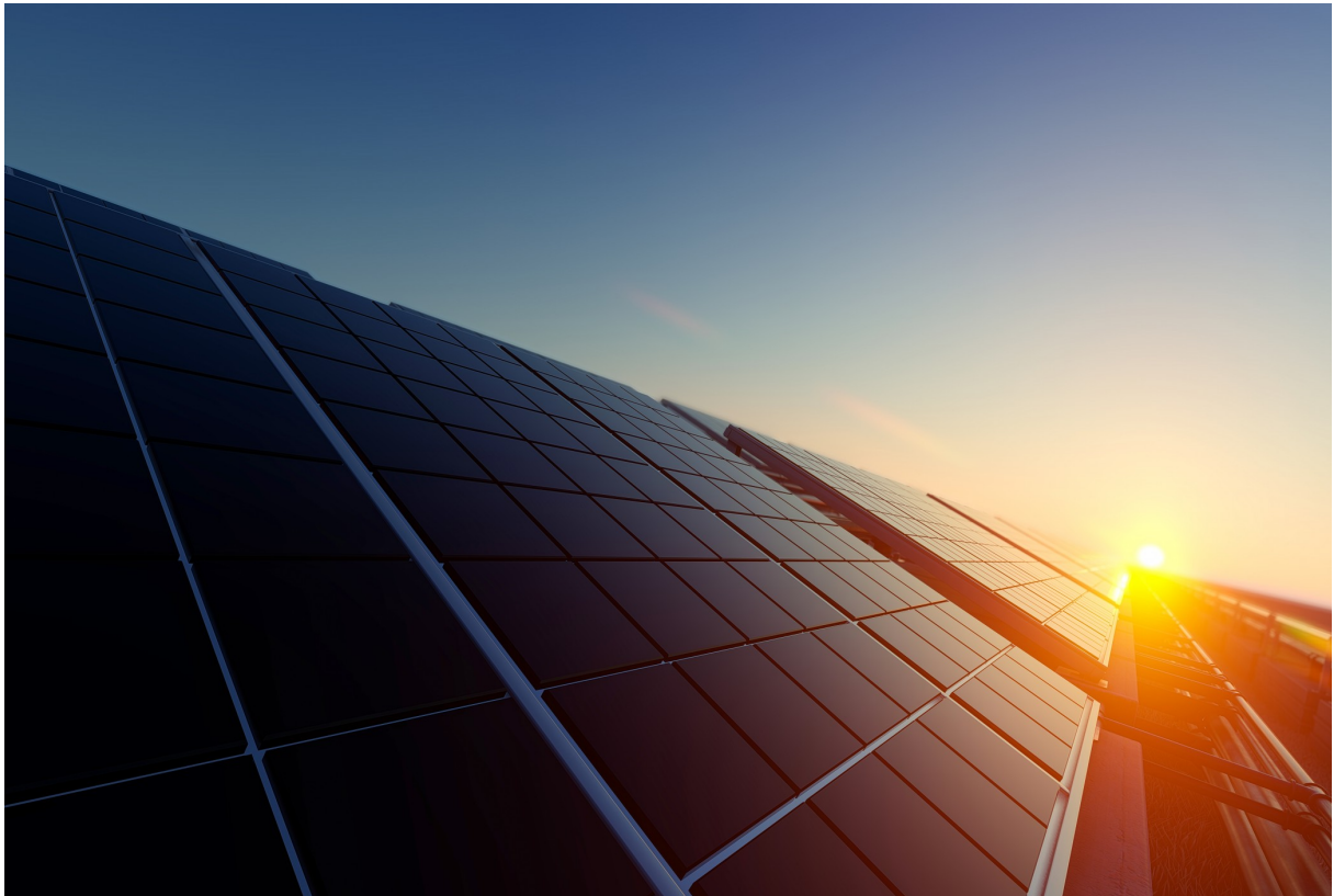
Photovoltaik-Anlagen könnten helfen, die Energiegewinnung zu dezentralisieren.

Dezentrale erneuerbare Energie-Systeme könnten die Energiewende vorantreiben. Vor allem ländliche Gebiete könnten ihren Energiebedarf in Zukunft so mehrheitlich selber decken.