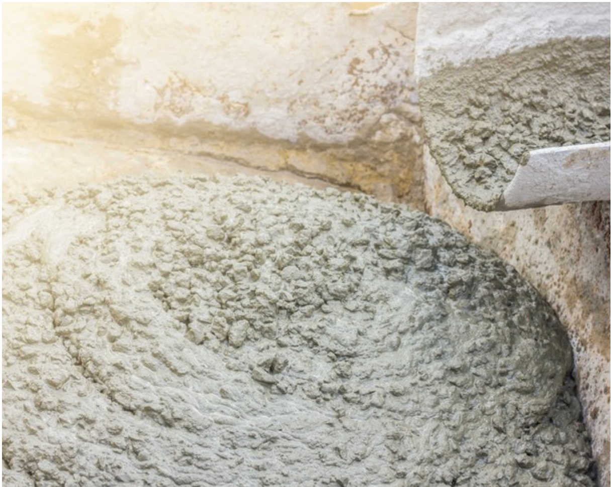
Textur aus Fertigbeton-Zementmörtel

Kein Material wird weltweit so viel hergestellt wie Beton. Dies ist energieintensiv und verursacht CO 2 . Eine neue Art von Beton mit weniger Zement ist umweltfreundlicher.