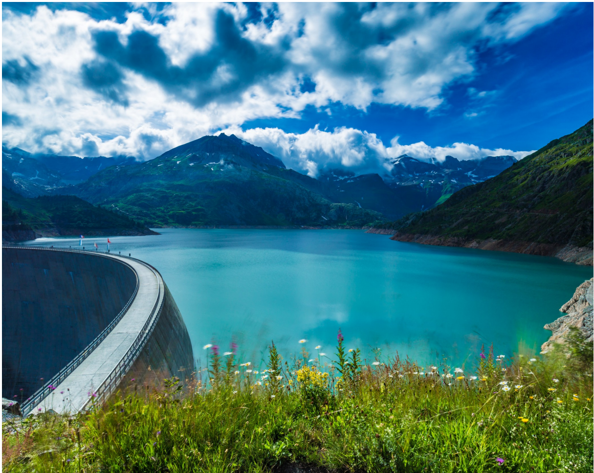
Staumauer in idyllischer Landschaft: Der Lac d'Emosson in den Walliser Alpen.

An Wasserkraftanlagen haben nicht nur Betreiber, sondern auch Gemeinden und Kantone ein wirtschaftliches Interesse. Doch diese Bauwerke haben grosse Eingriffe in die Natur zur Folge. Wichtig für eine erfolgreiche Planung von Nachrüstungen und Neubauten sind deshalb eine umfassende Analyse aller Nachhaltigkeitsaspekte und ein Dialog aller Akteure.