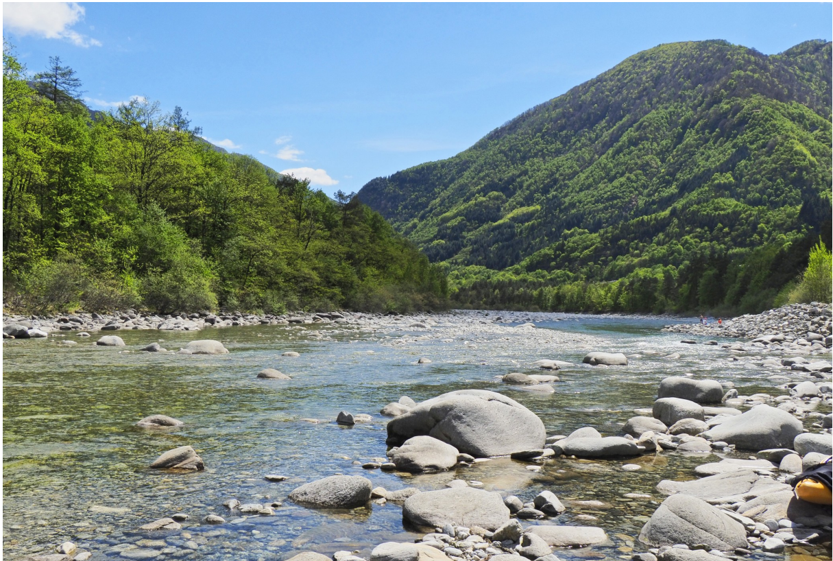
Wunderschön, aber nicht unberührt – die Flussauen der Maggia sind durch die Wasserkraft stark beeinträchtigt.

Laut Gesetz darf für die Wasserkraft ein Gewässer nie vollständig trockengelegt werden – ein Mindestabfluss muss stets vorhanden sein. Doch diese Restwasservorschrift leistet für den Schutz der Artenvielfalt unserer Bergflüsse zu wenig. So lautet das Resultat dieses Forschungsprojekts.