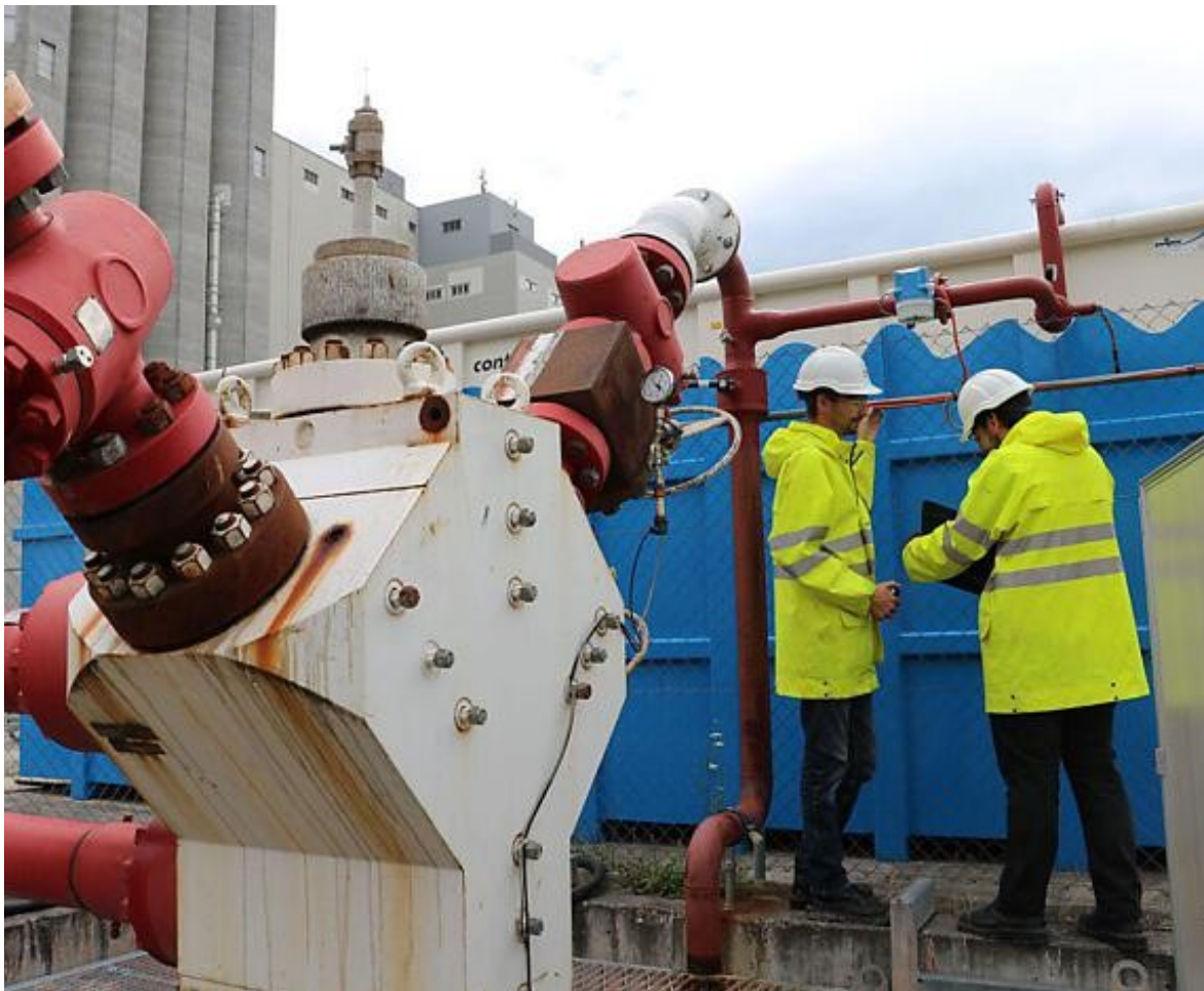
Vorderhand bleibt das Bohrloch ungenutzt – das Basler Pilotprojekt zur geothermischen Gewinnung von Strom und Wärme wurde wegen Erdbeben abgebrochen.

Aus tiefen Gesteinsschichten Erdwärme gewinnen und Strom produzieren – so bestechend die Idee, so vertrackt ist die Ausführung. Zwei Versuche, in der Schweiz die tiefe Geothermie als saubere Energiequelle zu erschliessen, mussten wegen Erdbeben abgebrochen werden. Nun sollen virtuelle Versuchsanlagen am Computer eine sicherere und zielgerichtete Entwicklung der Technologie ermöglichen.