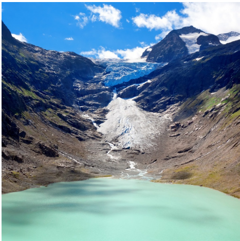
Periglazialzonen und Wasserkraft