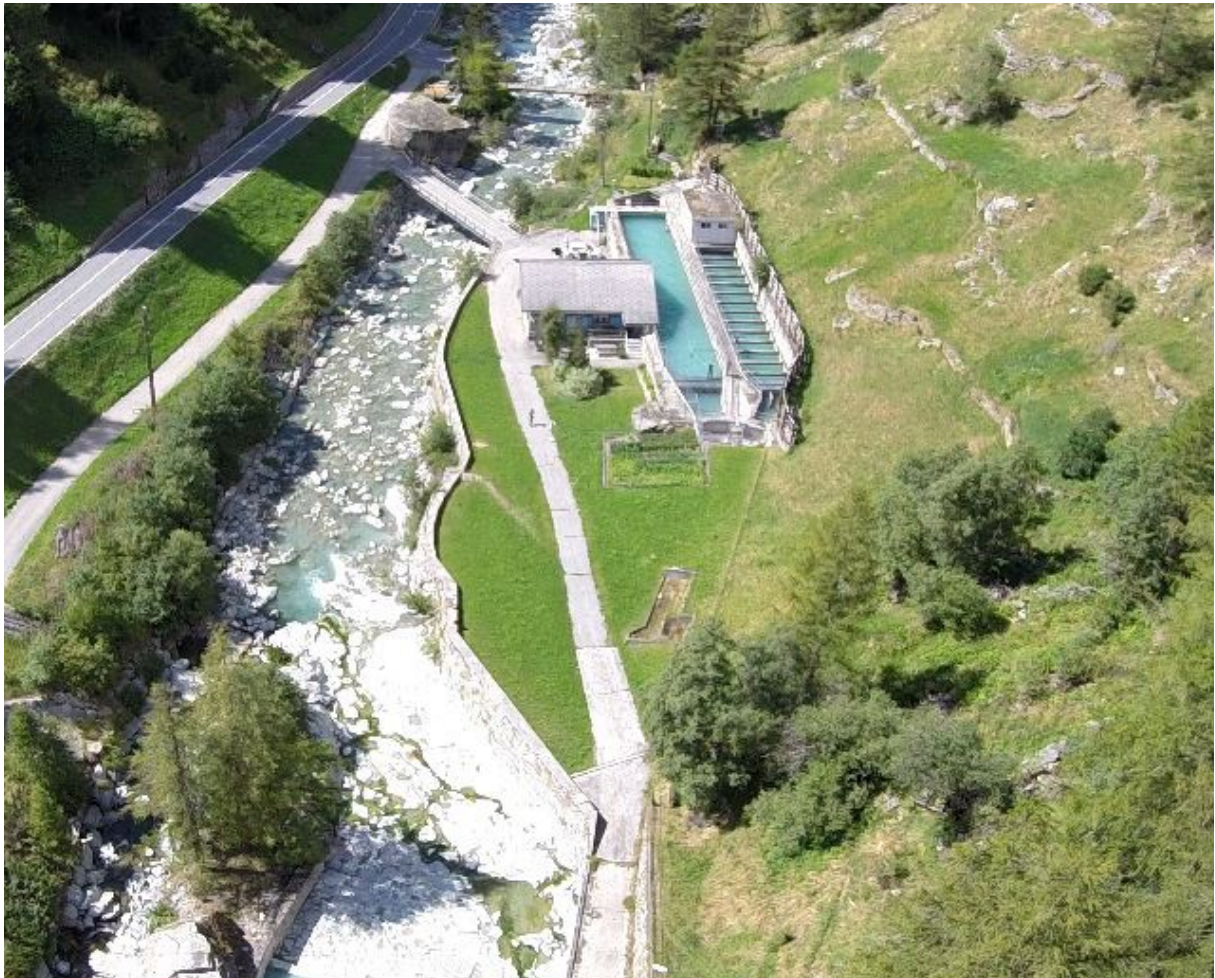
Bevor das Wasser Turbinen antreiben kann, muss es mit Entsanderanlagen gesäubert werden: Eine Anlage bei Saas-Balen im Kanton Wallis.

Wasser, das Kraftwerksturbinen antreibt, enthält trotz Entsanderanlagen immer noch Schwebstoffe. Diese greifen die Infrastruktur an und sind für Produktionsausfälle verantwortlich. Nun haben Forscher der ETH Zürich die Anlagen optimiert und neue Gestaltungsrichtlinien erarbeitet.