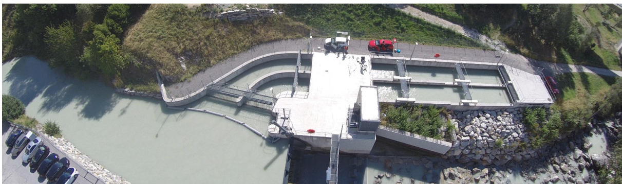
Die Entsanderanlage Wysswasser bei Fiesch im Kanton Wallis.

Das Rückgrat der schweizerischen Stromproduktion sind grosse Wasserkraftanlagen in den Alpen. Im Rahmen der Energiestrategie 2050 soll ihre Effizienz weiter steigen – doch kleine Partikel im Wasser stehen diesem Ziel im Weg: die Schwebstoffe. Die feinen Sedimente, welche die Flüsse mit sich führen, wirken an den Turbinen der Kraftwerke wie Schmirgelpapier und setzen ihnen zu. Zwar ist dieses Problem bekannt und die Kraftwerke verfügen über sogenannte Entsanderanlagen, welche die Schwebfracht reduzieren sollen: längliche Becken, in denen das Wasser möglichst langsam fliesst, damit sich die Partikel am Boden absetzen. Aber auch die neuste Generation dieser Anlagen erfüllt ihren Zweck nur teilweise. Darum benötigen die Turbinen häufiger Unterhaltsarbeiten und in dieser Zeit können sie keinen Strom produzieren – finanzielle Ausfälle sind die Folge. Schätzungen gehen von Kosten von rund 6 Millionen Franken jährlich aus, alleine in der Schweiz.