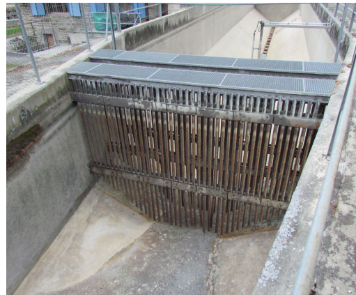
Solche Rechen in den Becken beruhigen die Strömung und tragen zur effizienten Entsandung bei.

Auch den Einfluss der Geometrie des Beckens untersuchten die Forscher. Es stellte sich heraus, dass es kaum einen Einfluss hat, wie der Kanal sich zum Becken hin verbreitert – also ob er sich kontinuierlich weitet oder schlagartig in die volle Breite übergeht. Anders sieht es beim vertikalen Winkel aus, also wie der Kanal sich vertieft: Eine sanfte Rampe verursacht weniger Wirbel als eine steile Wand. Dies ist wichtig für eine effiziente Abscheidung der Partikel.