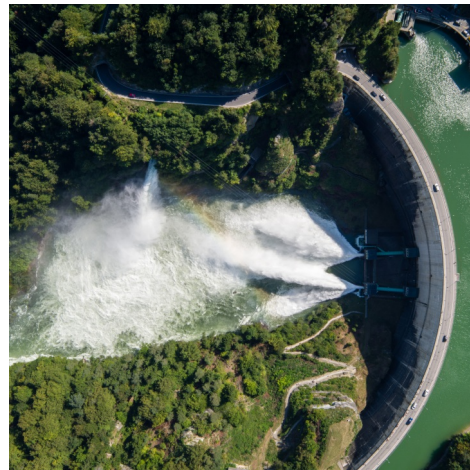
Nachhaltiges Auenmanagement und Wasserkraft