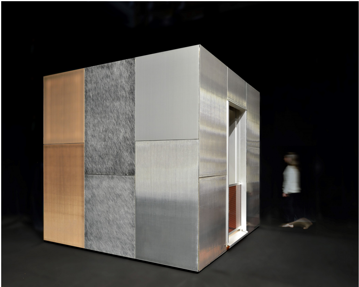
Der Demonstrationswürfel zeigt im Originalmassstab die ästhetischen und technischen Möglichkeiten der neuen Fassadenelemente mit integrierter Photovoltaik.

Bei der Entwicklung besserer Solarmodule zählt bislang Ästhetik nicht zu den Hauptkriterien. Und Architekten denken bei ihren Entwürfen nicht als erstes an Sonnenenergie. Forschende des CSEM in Neuenburg und der EPFL Lausanne wollen dies ändern, um das Potenzial der Gebäude zur Stromerzeugung voll auszunutzen.