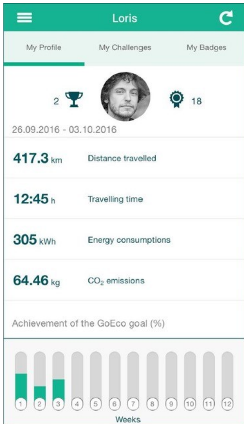
Wöchentliche Zusammenfassung des Mobilitätsverhaltens in der App. SUPSI

Um die Testpersonen zusätzlich zu motivieren, bot ihnen die App die Möglichkeit, sich persönliche Ziele zu setzen und Challenges zu absolvieren. Solche Challenges waren zum Beispiel, das Auto das ganze Wochenende lang nicht zu benutzen oder in dieser Woche sämtliche kurzen Routen zu Fuss oder mit dem Fahrrad zurückzulegen. Anhand der Erreichung ihrer persönlichen Ziele und davon, wie viele Challenges sie erfolgreich absolvierten, konnten die User sich dann mit anderen Teilnehmenden messen.