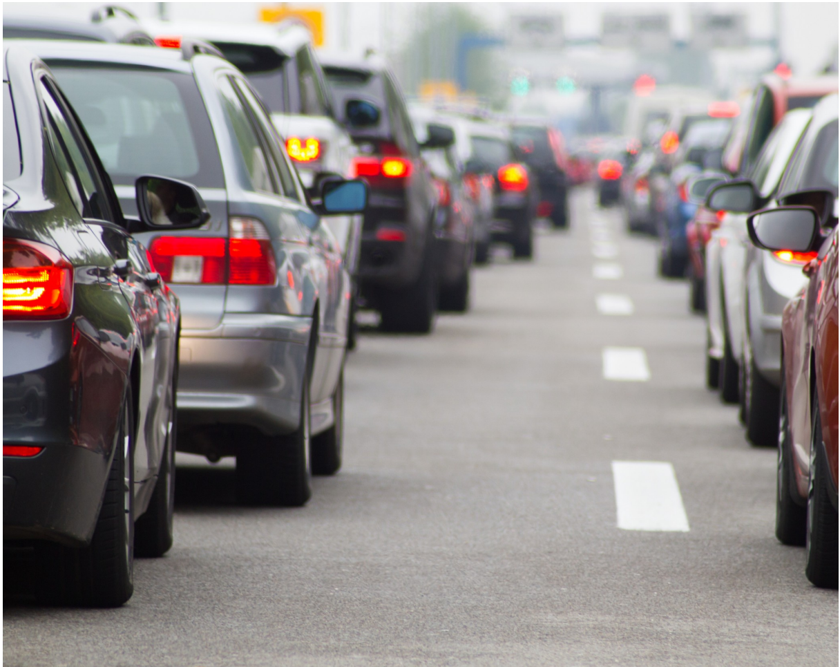
Nichts als rote Bremslichter: Ein alltägliches Bild auf den Strassen der Schweiz.

Würden mehr Leute öfter auf das Auto verzichten, könnte eine grosse Menge an Energie gespart werden, was wiederum weniger CO 2 -Emissionen bedeuten würde. Eine App namens *GoEco!* will das Verhalten ihrer Nutzer so verändern, dass sie nachhaltiger und klimafreundlicher unterwegs sind.