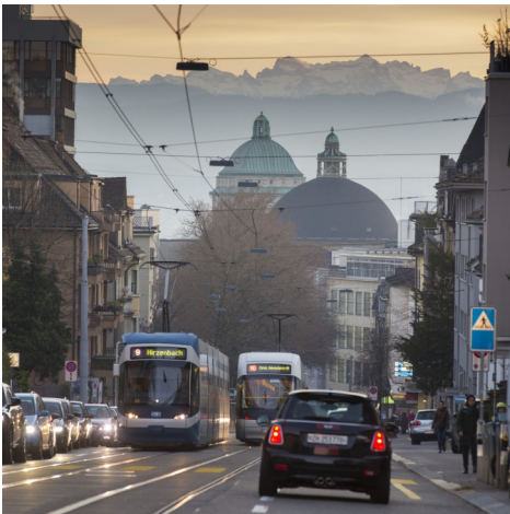
Teilen ist Sparen

Carsharing hilft, Energie zu sparen – aber nur wenn die Dienste reguliert sind